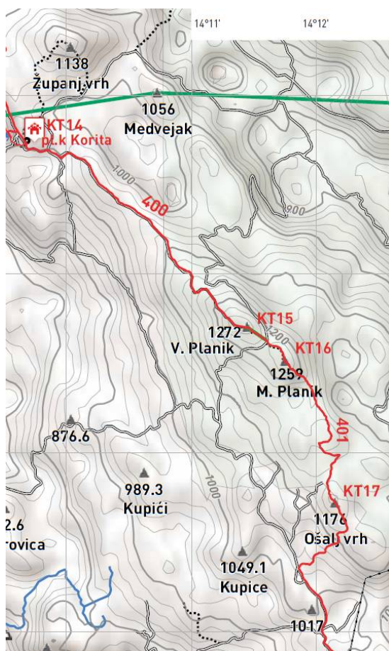
Detalj zemljovida IPP-a