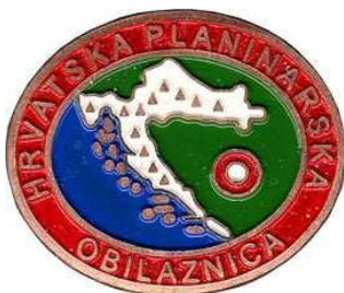
Brončana značka HPO