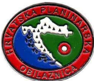
Srebrna značka HPO