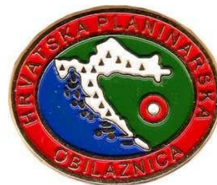
Zlatna značka HPO