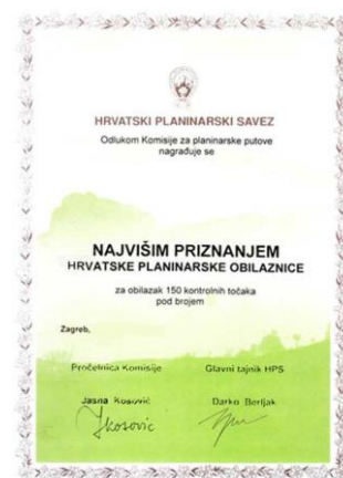
Najviše priznanje HPO

Prvo izdanje dnevnika Hrvatske planinarske obilaznice imalo je 135 kontrolnih točaka i četiri stupnja priznanja (brončanu, srebrnu i zlatnu značku, te posebno priznanje). U drugom izdanju iz 2002. godine dodano je visoko priznanje. U trećem izdanju, ožujak 2005. dvije kontrolne su zamijenjene i uvršteno ih je još 13. Ukupni broj kontrolnih u trećem izdanju popeo se na ukupno 148. U izdanju dnevnika iz 2007. godine dodane su još tri kontrolne točke (ukupno: 151 KT) i uvedeno je najviše priznanje HPO. Slijedeće – peto izdanje, nije pretrpjelo znatnije izmjene, a u posljednjem, 6. izdanju (2011. g.) ukinute su dvije i dodane tri kontrolne točke. Time se ukupni broj kontrolnih točaka HPO popeo na 152. Sve kontrolne točke grupirane su u 20 područja.