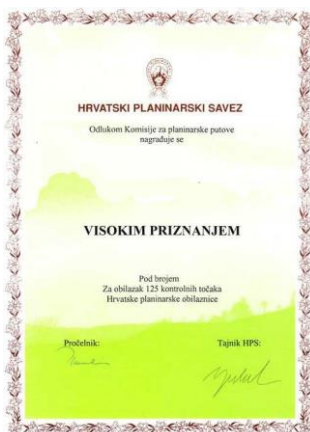
Visoko priznanje HPO