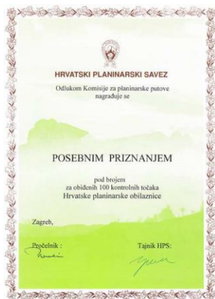
Posebno priznanje HPO