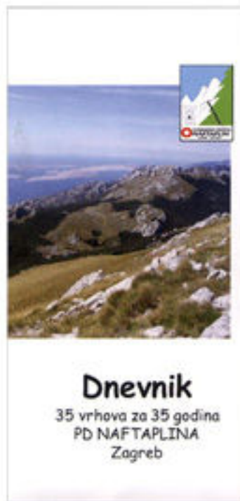
Naslovnica dnevnika obilaznice

dnevnik je moguće naručiti pismom na adresu društva, te mailom i mobitelom od osobe za kontakt, a kupiti ga je moguće u prostorijama PD Naftaplina, Gajeva 46, Zagreb, utorkom od 19:30 – 20:00 sati; u cijeni dnevnika uključena je značka obilaznice.