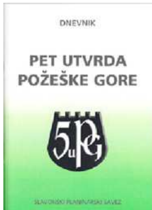
Naslovnica dnevnika obilaznice